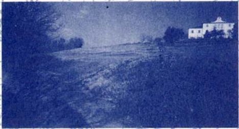
STRADA DELLA SERRA