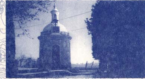
CAPELLA DI S. IRENE