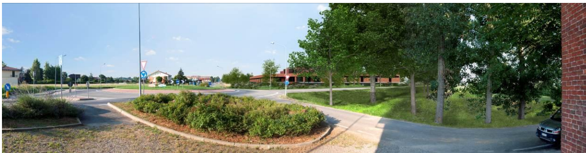
Cono visivo D – rendering.