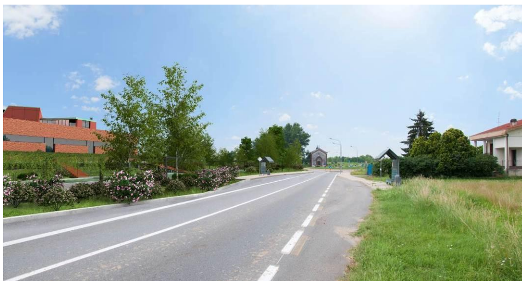
Cono visivo B – rendering.