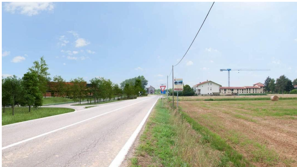
Cono visivo A – rendering.