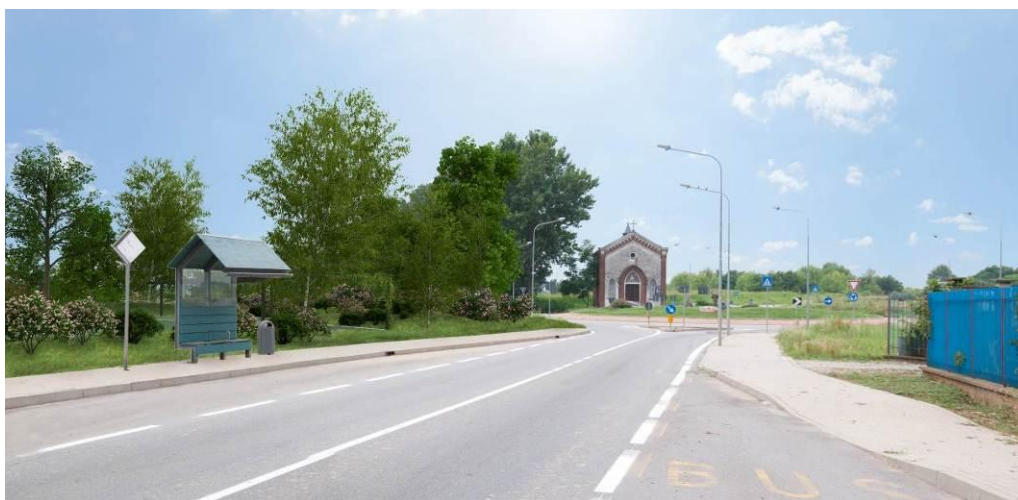
Cono visivo C – rendering.