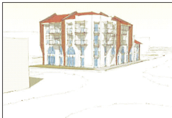
Fig.2 Intervento in progetto